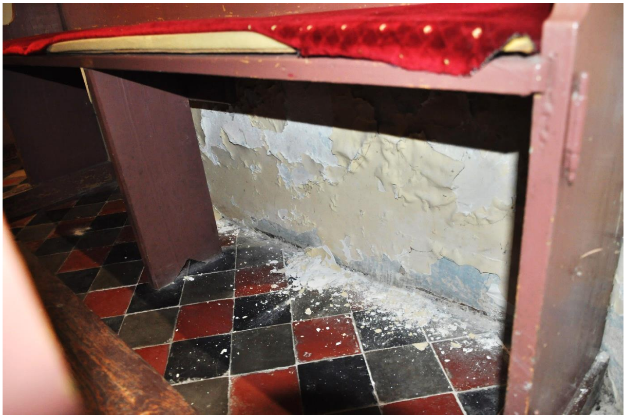
Fot. 8. Zieleń, wewnątrz kościoła, prezbiterium. Silne odpadanie tynku wraz z warstwą farby.