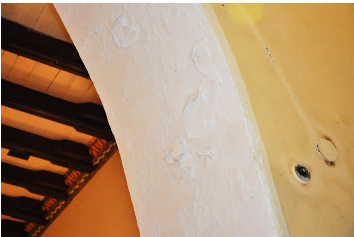
Fot. 10. Zieleń, wewnątrz kościoła, prezbiterium. Arkada pokryta warstwami, które uległy odspojeniu i silnie osypują się.