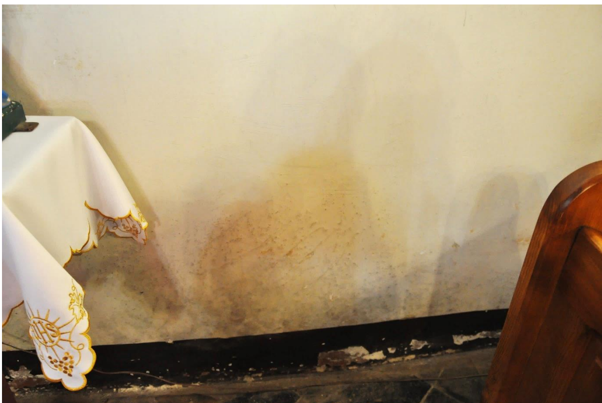
Fot. 12. Zieleń, wewnątrz kościoła, nawa.