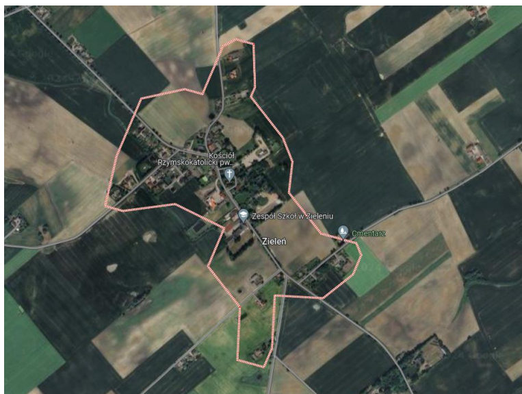
Fot. 13. Położenie miejscowości Zieleń, fragment mapy.

Miejscowość Zieleń, położona jest w województwie kujawsko-pomorskim, w powiecie wąbrzeskim, w gminie Ryńsk. Budynek znajduje się na działce nr 127/1, pod adresem: Zieleń 17, 87-200 Wąbrzeźno.