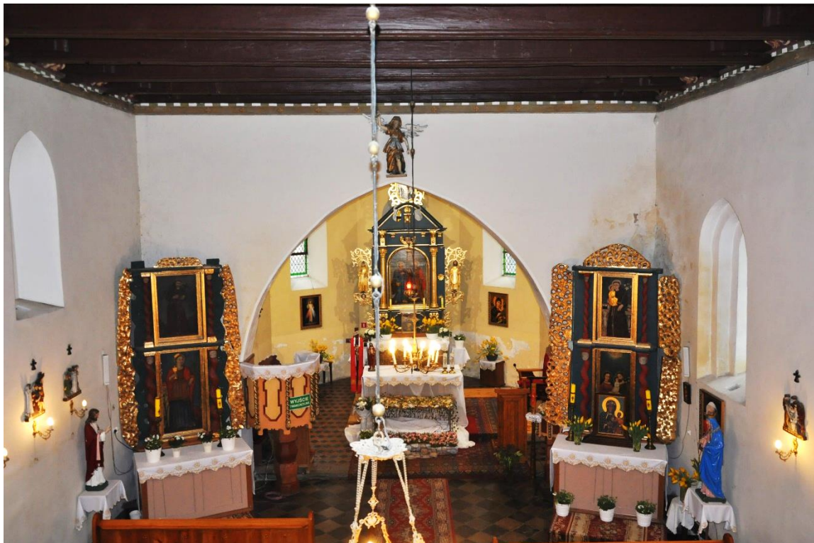
Fot. 4. Zieleń, wnętrze kościoła, nawa.