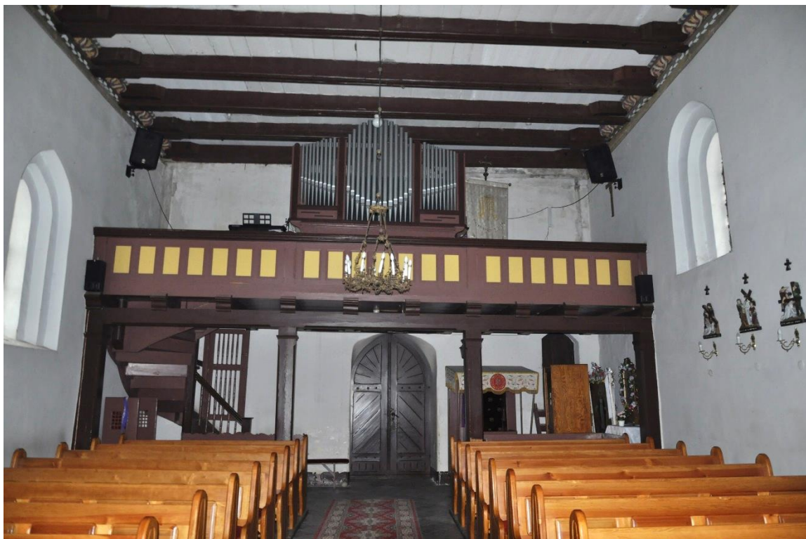
Fot. 5. Zieleń, wnętrze kościoła, nawa.