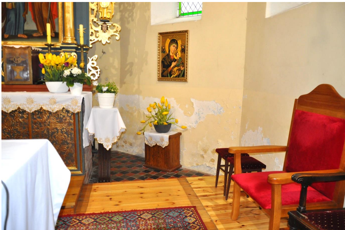
Fot. 9. Zieleń, wewnątrz kościoła.