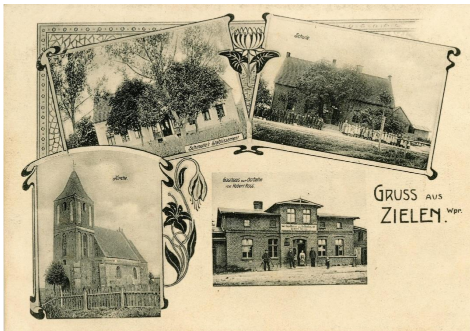
Fot. 2. Poczтівka z 1910 roku. W lewym dolnym rogu zdjęcie kościoła w Zieleniu.

W 2020 roku został wykonany remont na całym kościele więźby dachowej na oraz zostało położona dachówka ceramiczna mnich-mniszka. W 2022 i 2023 fragmenty ścian kościoła zostały poddane remontowi konserwatorskiemu.