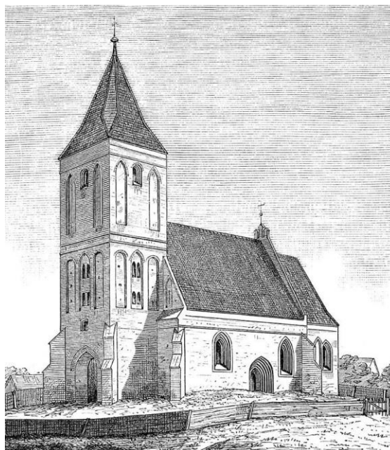
Fot. 1. Rycina z końca XIX wieku wg. J. Heise

Kościół został odnowiony w 1925 roku. Następnie po kilkunastu latach, w 1937 roku przeprowadzono remont kościoła. Wykonano reperację szkarp po przez przemurowanie niektórych partii. Wykonano odwodnienie przy kościele. Usunięto malowidła z XIX wieku. W kolejnym roku 1938 wykonano malowanie wnętrza. Prace wykonał artysta malarz P. Stefan Wojciechowski z Grudziądza. Kościół wówczas pomalowano monochromatycznie. W 1988 rok wymieniono drzwi zewnętrzne główne. W latach 90 XX wieku położono nową dachówkę ceramiczną na podłożu z folii.