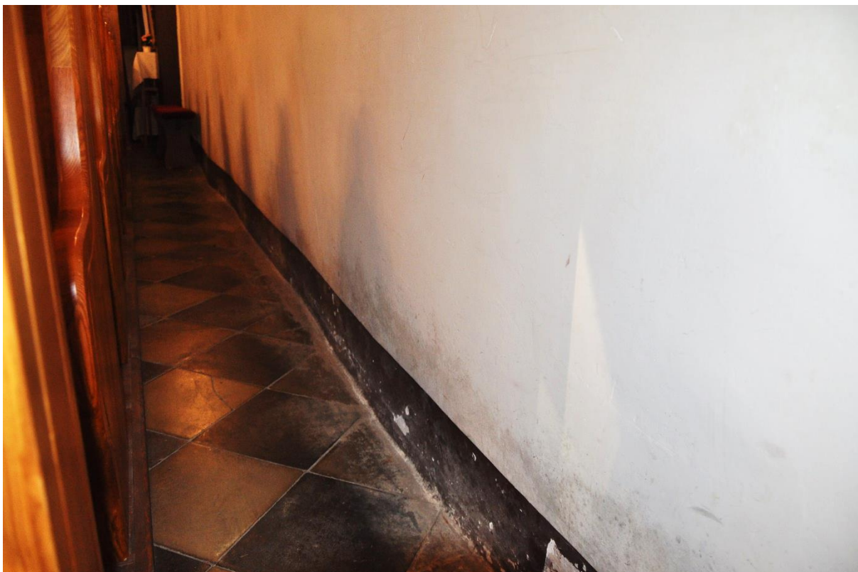
Fot. 11. Zieleń, wewnątrz kościoła, nawa.