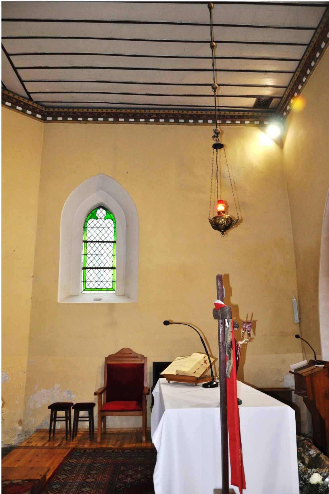
Fot. 6. Zieleń, wnętrze kościoła, prezbiterium. Dolna część ściany pokryta farbą ftalową, blokującą odparowanie wilgoci.