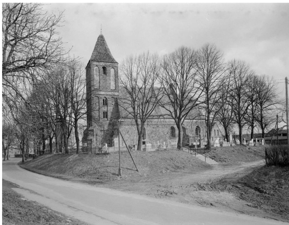
Fot. 3. Zdjęcie z 1992 roku.