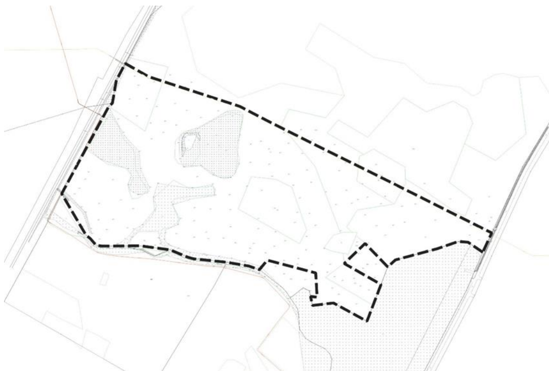
Rysunek 1 Obszar objęty planem miejscowym, oprac. własne

rozwój powinien być realizowany w oparciu o miejscowe plany zagospodarowania przestrzennego- tereny realizacji zabudowy o funkcjach gospodarczych.