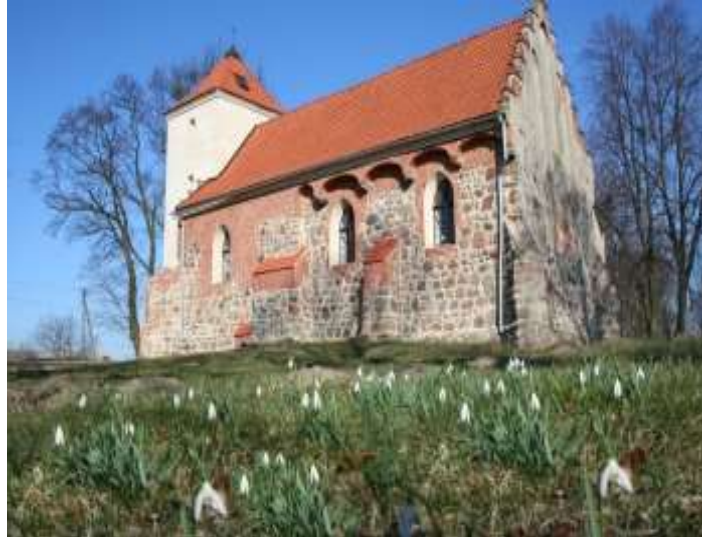
Kościół p.w. św. Wawrzyńca