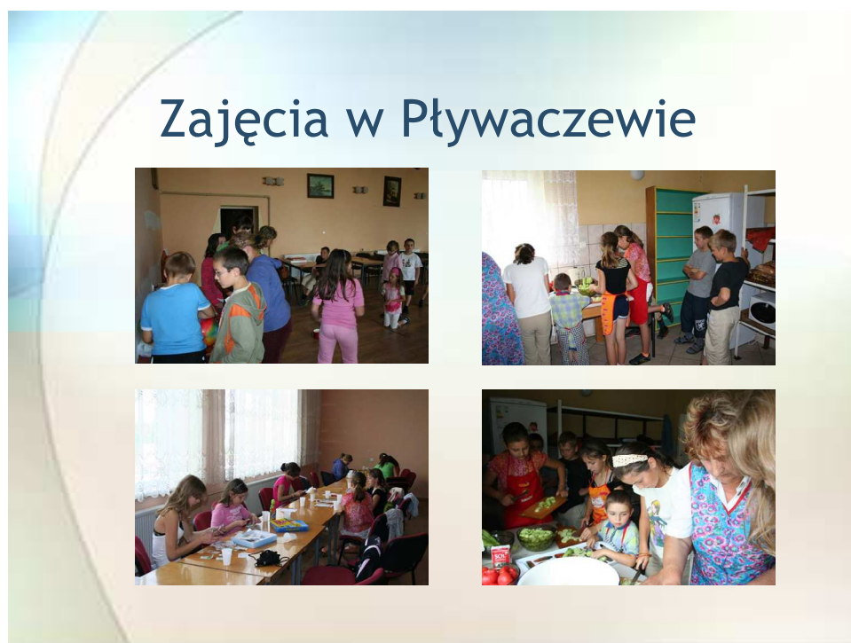
Zajęcia z dziećmi w świetlicy wiejskiej

Życie mieszkańców Pływaczewa skupia się głównie wokół własnych domostw, bieżące zaś problemy i nurtujące społeczność sprawy poruszane są głównie na zebraniach sołeckich. W Pływaczewie istnieją prężnie działające w środowisku Koło Gospodyń Wiejskich oraz Ochotnicza Straż Pożarna. KGW jest głównym organizatorem zajęć dla dzieci.