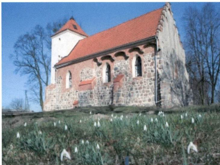
Kościół p.w. św. Wawrzyńca