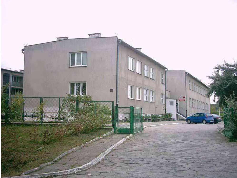
Zespół Szkół we Wroniu

1 września 1991r. uruchomiono w ZSR we Wroniu pierwsze w Polsce, a trzecie w Europie 4-letnie Liceum Rolnicze o specjalności gospodarka łowiecka, które kształtowało absolwentów - przyjaciół i opiekunów zwierzyny oraz świątłych ekologów praktyków. 1 września 1998r. uruchomiono Technikum Rolnicze o specjalności agrobiznes . 1 stycznia jest przełomem dla ZSR we Wroniu, placówka przestaje być szkołą resortową, a organem prowadzącym zostaje Starostwo Powiatowe w Wąbrzeźnie. 1 września 2002r. decyzją Rady Powiatu zmieniono nazwę szkoły na Zespół Szkół we Wroniu. Nowa nazwa to nowe możliwości i nowe kierunki nastawione na kształtowanie technologii informacyjnych: 3-letnie Liceum Profilowane Zarządzanie Informacją , 3-letnie Liceum Profilowane Ekonomiczno-Administracyjne , 4-letnie Technikum Rolnicze , 2-letnie Studium Policealne – Technik Informatyk i 2-letnie studium Policealne – Technik Administracji .