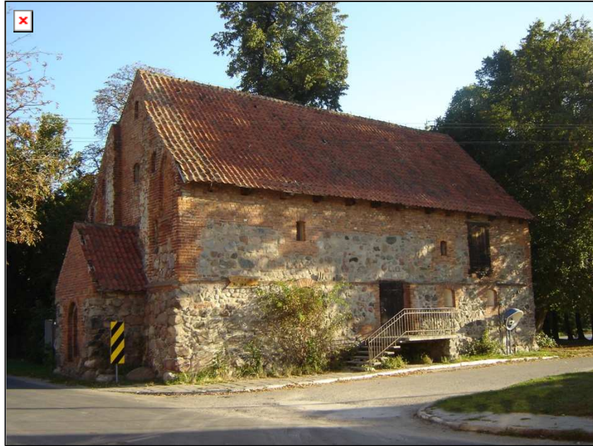
Wronie- zabytkowy XIV wieczny kościółek

Zabytkowy kościółek gotycki we Wroniu (obecnie spichlerz), zbudowany został z kamienia polnego i cegły w I połowie XIV wieku. Kościół odnowiono na początku XVII w. Zniszczony i opuszczony po wojnach szwedzkich został później zamieniony na spichlerz. Korpus kościoła posiada salowy, prostokątny kształt. Od zachodniej strony istnieją ślady dawnej wieży kościelnej, od północnej zaś – zakrystii. Otwory okienne i wejściowe zostały przemurowane. Portal zachodni dawnej świątyni jest ostrołukowy, a w ścianach bocznych widnieją częściowo zniekształcone blendy ostrołukowe. Siodłowy dach budynku pokryty jest dachówką.