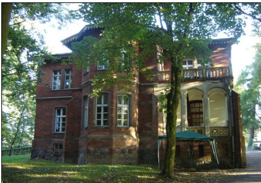
Wronie – pałacyk myśliwski z końca XIX w.

Do ciekawszych pozostałości kultury minionych stuleci zaliczyć należy XIX wieczny dworek myśliwski.