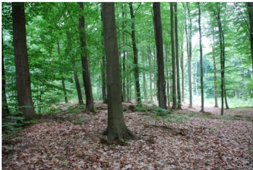
Rezerwat buków pomorskich we Wroniu