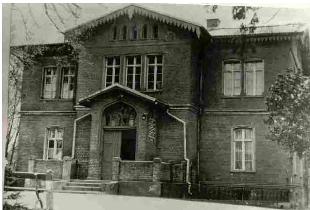
Pałacyk myśliwski – pierwsza siedziba szkoły

Szkoła rolnicza utworzona 1 września 1959r. nosiła nazwę: Dwuzimowa Szkoła Rolnicza . Rolnicy z okolicznych wsi zdobywali kwalifikacje do prowadzenia gospodarstw indywidualnych, które w owych latach zaczęły się dynamicznie rozwijać. Początkowo baza lokalowa mieściła się na 25m 2 zabytkowego pałacyku myśliwskiego.