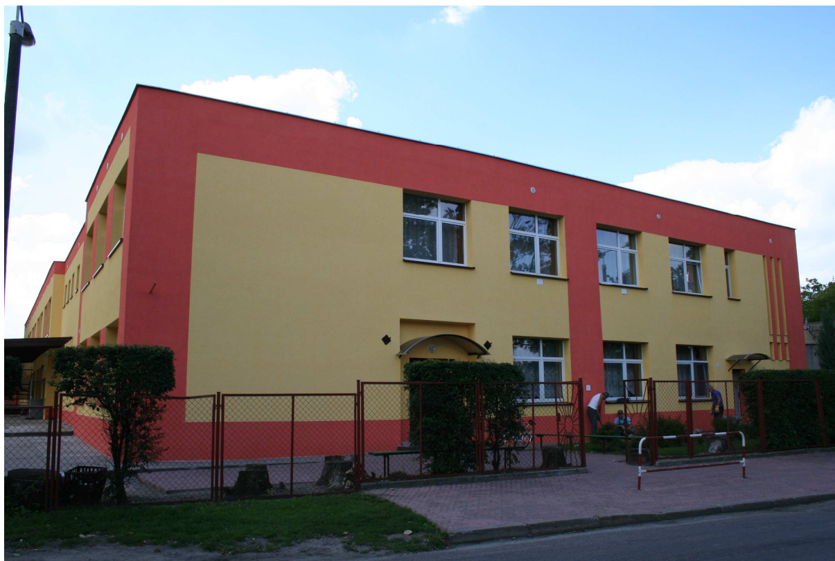
Zespół Szkół w Zieleniu

Na terenie Zielenia istnieje zespół szkół obejmujący Szkołę Podstawową im. Tadeusza Kościuszki oraz Gimnazjum. Wymieniona placówka oświatowa korzysta z sali gimnastycznej. Ponadto we wsi funkcjonuje remizo-świetlica, Ośrodek Zdrowotny. Podstawowe usługi handlowe dla mieszkańców zapewniają 2 sklepy różnych branż.