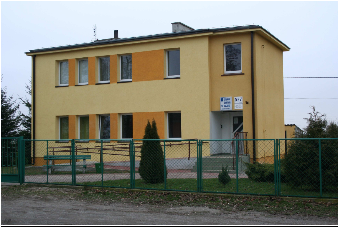
Ośrodek zdrowia w Zieleniu