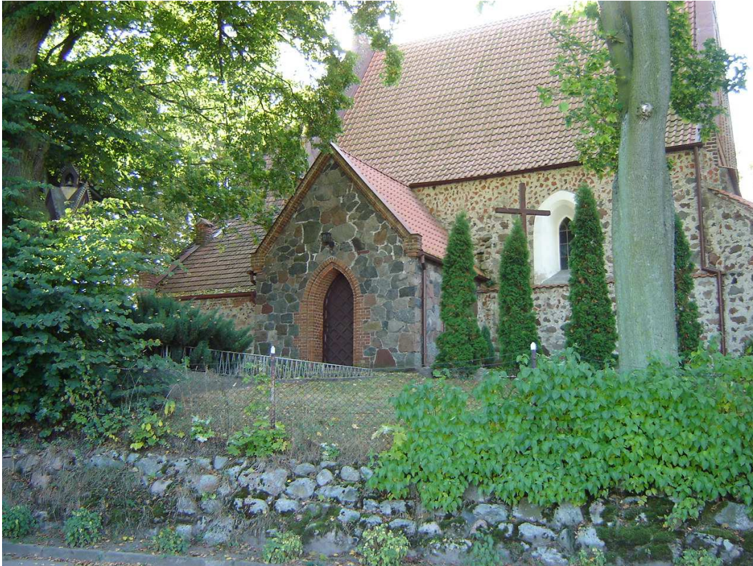
Kościół p.w. św. Marii Magdaleny w Orzechowie