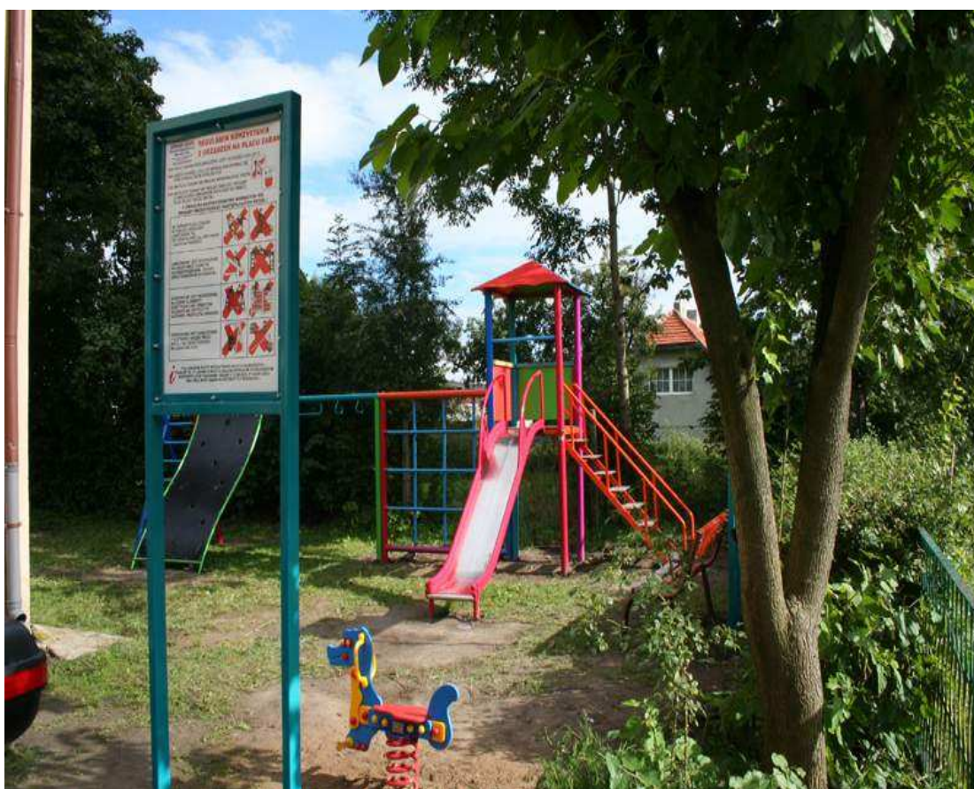
Plac zabaw dla dzieci w Orzechowie

Życie mieszkańców Orzechowa cechuje wzrastająca aktywność, umiarkowane działanie, rozważa i przedsiębiorczość. Do aktywnie działających kół i organizacji zaliczyć należy Koło Gospodyń Wiejskich i Ochotniczą Straż Pożarną. Problemy mieszkańców wysuwane są i omawiane głównie na zebraniach wiejskich bądź też zgłaszane indywidualnie do sołtysa i przekazywane do uwzględnienia ich w planach realizacji. Istnieje pilna potrzeba wyremontowania budynku świetlicy wiejskiej wraz z zagospodarowaniem terenu oraz urządzenia boiska sportowego.