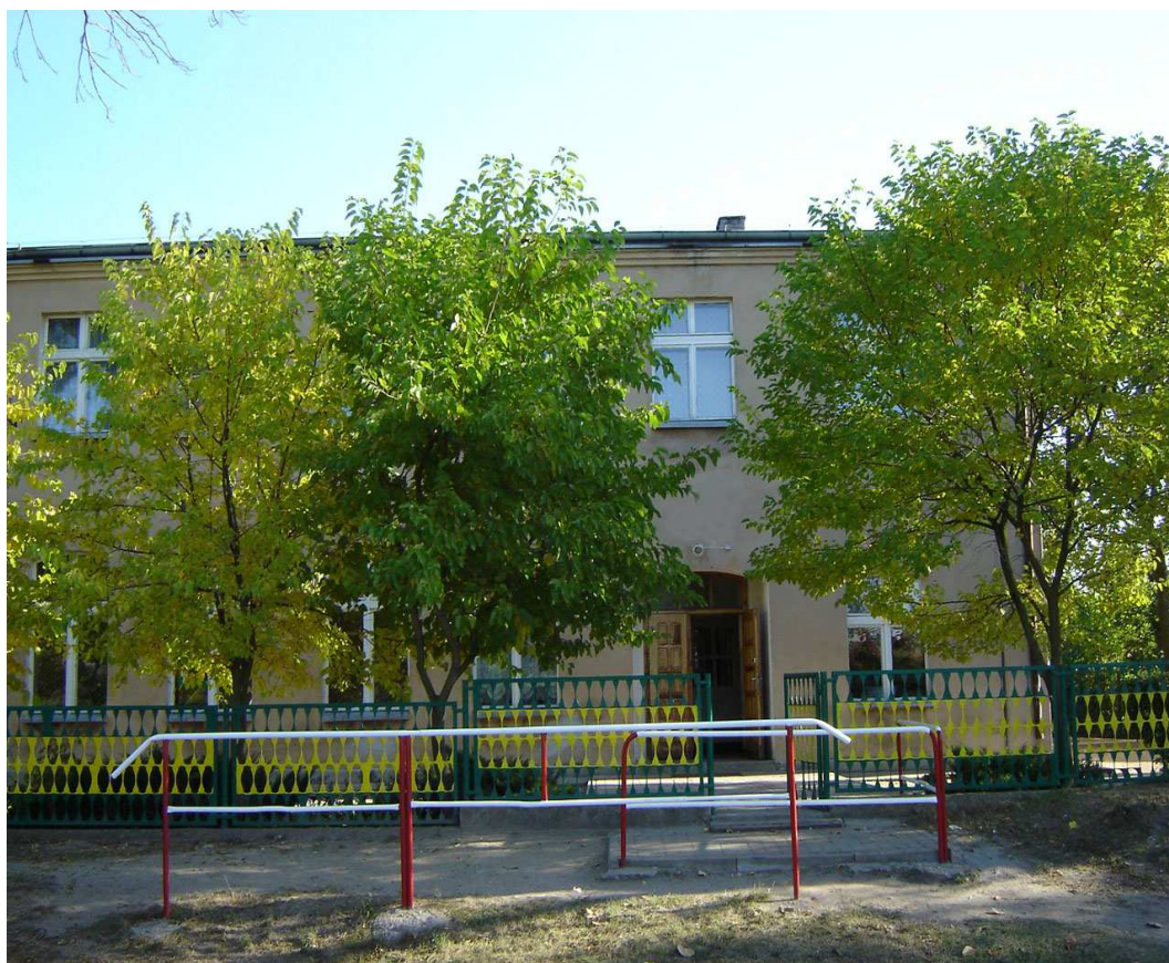
Budynek świetlicy wiejskiej w Orzechowie

Do grupy obiektów architektury i budownictwa o wartościach kulturowych należą również budynki szkół podstawowych, wzniesione w II poł. XIX w. i na pocz. XX w., w tym budynek szkolny w Orzechowie, budynek plebanii w Orzechowie oraz budynki mieszkalne i zabudowania gospodarcze wzniesione w XIX w. i I poł. XX w. Obecnie w budynku po byłej szkole podstawowej w Orzechowie funkcjonuje świetlica wiejska wymagająca gruntownego remontu.