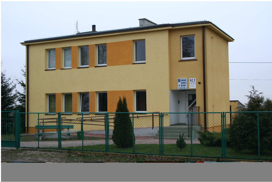
Ośrodek zdrowia w Zieleniu