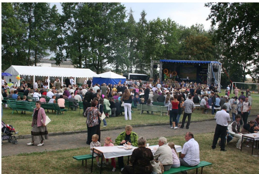
Gminno – powiatowe uroczystości dożynkowe w 2009 r.