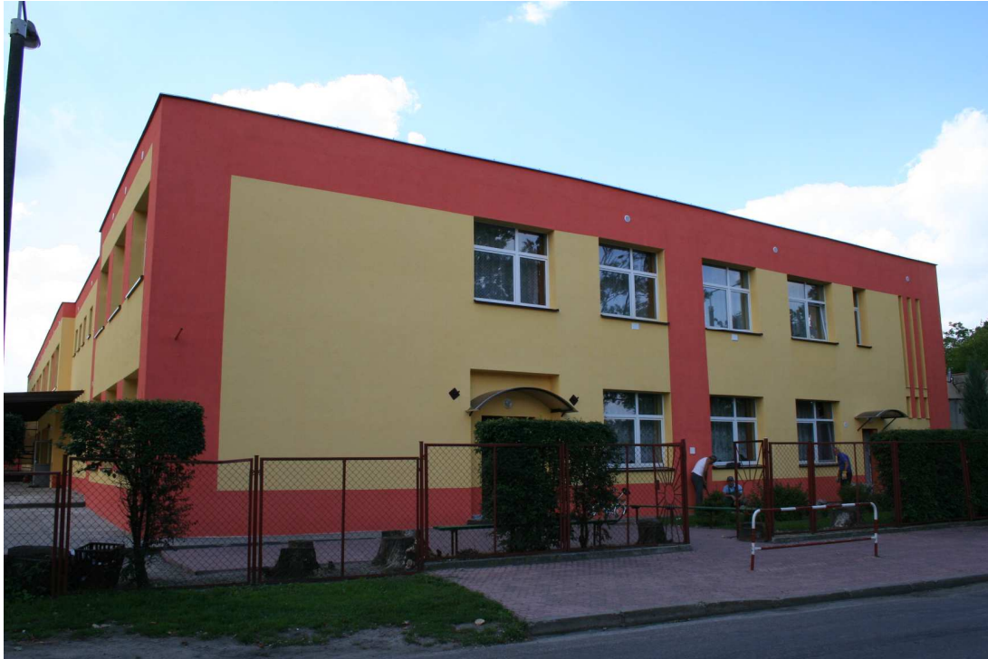
Zespół Szkół w Zieleniu